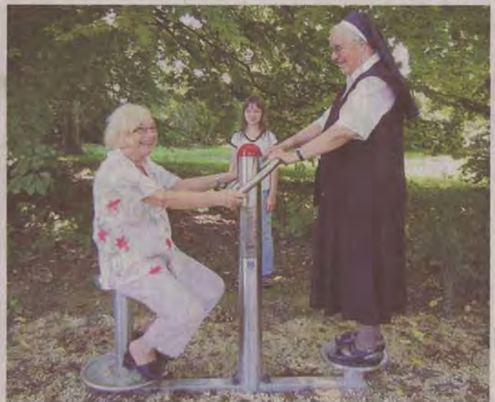
Die Fitnessübungen machen offensichtlich auch Spass.